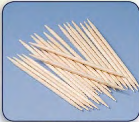
Holz-Zahnstocher, Länge: ca. 8 cm 10320 1000 St. -/80