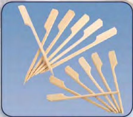
Bambus-Fingerfood-Spieße, Länge: ca. 9 cm, Ø ca. 3 mm 10520 200 St. -/20 Länge: ca. 12 cm, Ø ca. 3 mm 10521 200 St. -/20