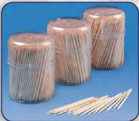
Holz-Zahnstocher, Länge: ca. 67 mm 10305 3x 500 St. -/40