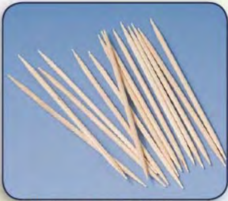
Holz-Zahnstocher, Länge: ca. 67 mm 10311 150 St. 24/576 10312 300 St. 12/288 10321 Länge ca. 65 mm 1000 St. 12/72