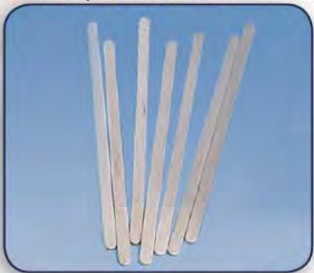
Holz-Kaffeerührer, Länge: ca. 14 cm, Ø ca. 6 mm 10705 1.000 St. -/20