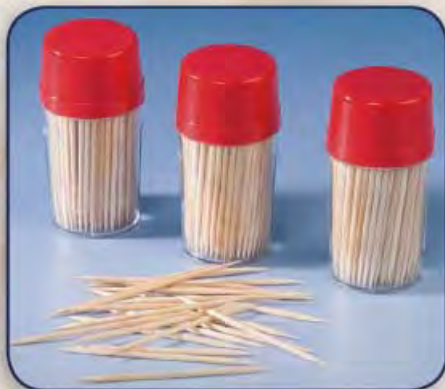
Holz-Zahnstocher, Länge: ca. 65 mm, im Verkaufsdisplay 10301 190 St. 24/240