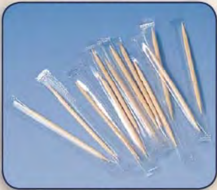
Holz-Zahnstocher, in Cello-Hüllen, Länge: ca. 65 mm 10322 1.000 St. 12/72