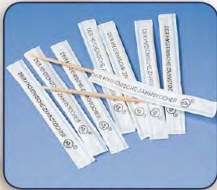
Holz-Zahnstocher, in Papier-Hüllen, Länge: ca. 65 mm 10323 1.000 St. 12/72